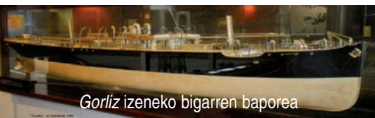
Gorliz izeneko bigarren baporea

Garai hartan bazen, baita ere, Gorliz izeneko goleta bat, Ugarte Zabala anaiena