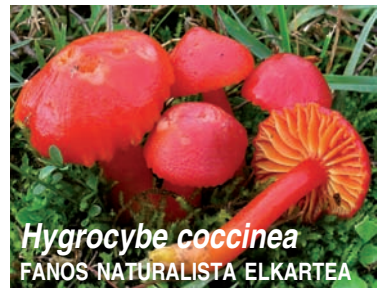
Hygrocybe coccinea FANOS NATURALISTA ELKARTEA

6 domeka xxxvi. Perretxiko Erakusketa domingo - Exposición micológica astilleron xxxvi. Umeentzako Lehiaketa - Concurso micológico infantil Perretxiko dastapena - Degustación de setas Sari-banaketa - Entrega de premios