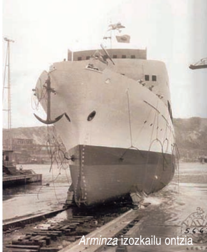
Arminza izozkailu ontzia

(Gorlizeko Juan Ignacio, Marcelino eta Juan), Filipinak eta Japonia arteko linea egiten zuena. Gorliz izeneko azken ontzia 1919an egin zen, baina gradan baino ez zuen mantendu izena (Nervión ontzian eraikia izan ondoren Ibarra konpainiak erosi zuen eta Cabo Ortegal izena jarri zioten).