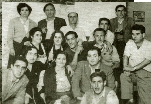
Grupo de plencianos en 1953

Lo primero en que empleo más tiempo del que pensaba al dirigirme a mi amado pueblo de Plencia no es la distancia, sino la alegría y cariño que experimento que por fin llego al lugar donde voy a sentir un gran entusiasmo y bienestar, y esto lo considero como algo fantástico, que no podía ponerlo en duda.