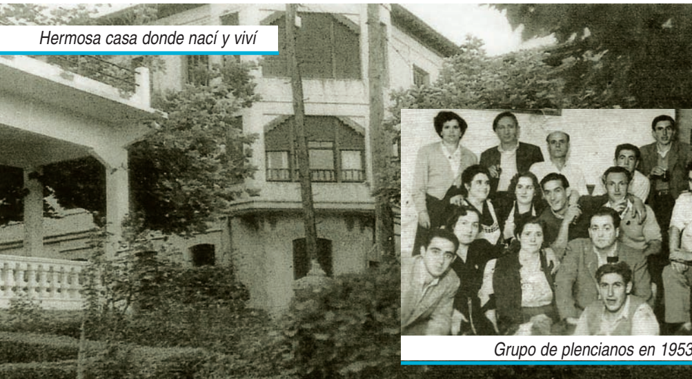
Hermosa casa donde nací y viví